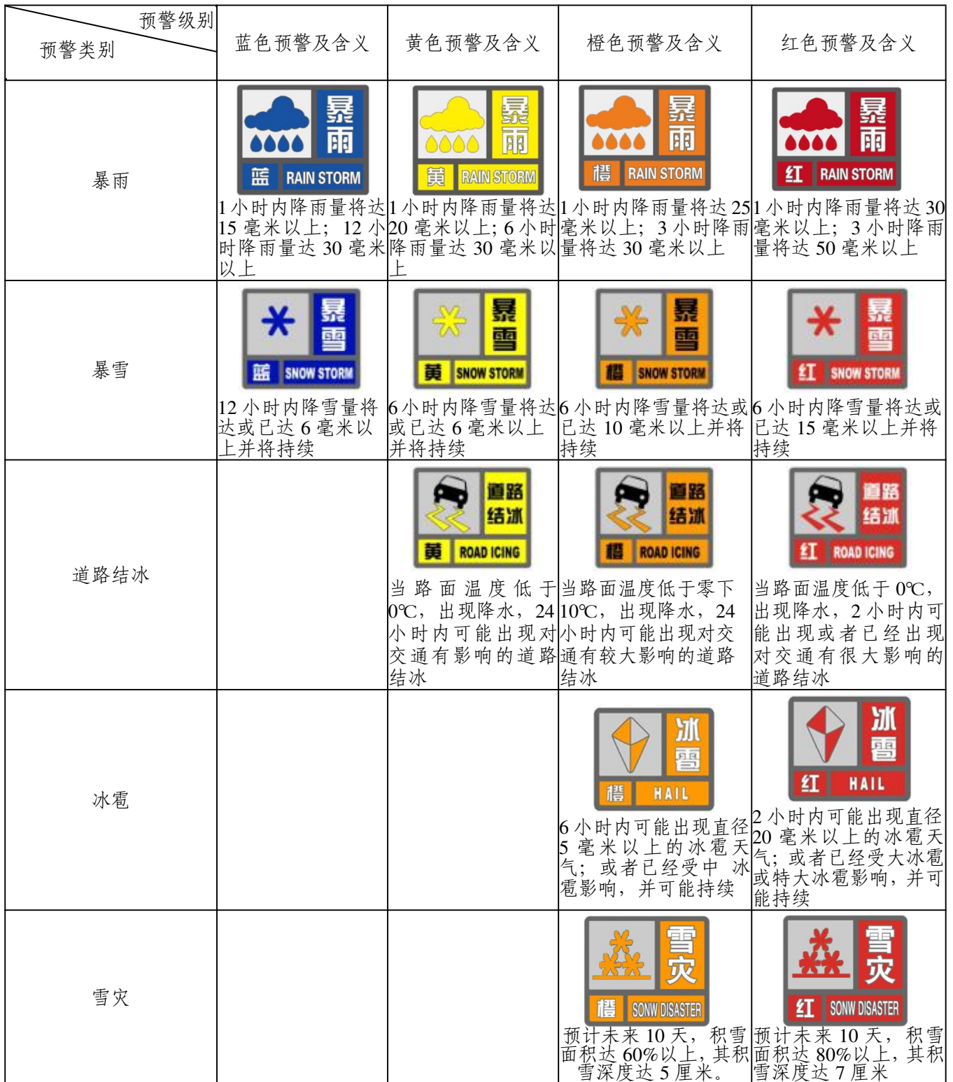
表 1 雨雪冻冰预警信号一览表